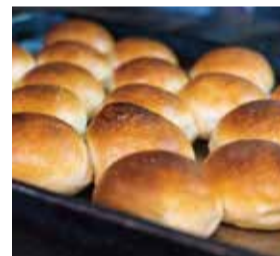
焼き立てほかほか! 「塩バターパン」の おいしさに2人とも 思わずこの表情!

スカーレット (Bakery Scarlet) 神戸市兵庫区下沢通5-2-12 / TEL 078-578-0212 定休日 火曜 金曜 / 7:00~18:00