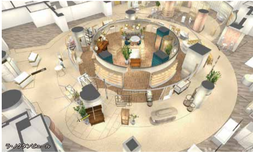
ラ・ノクタンビュール

神戸コレクション2023に「Time of “Grace”」のファッションが登場