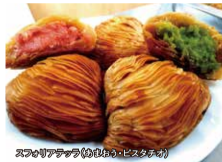
スフォリアテッラ(あまおう・ピスタチオ)

福岡からは「オスピターレ」が来店。外はバリッパリッ、中はトロッ。話題のイタリア伝統のドルチェ「スフォリアテッラ」(各税込380円)を販売します。