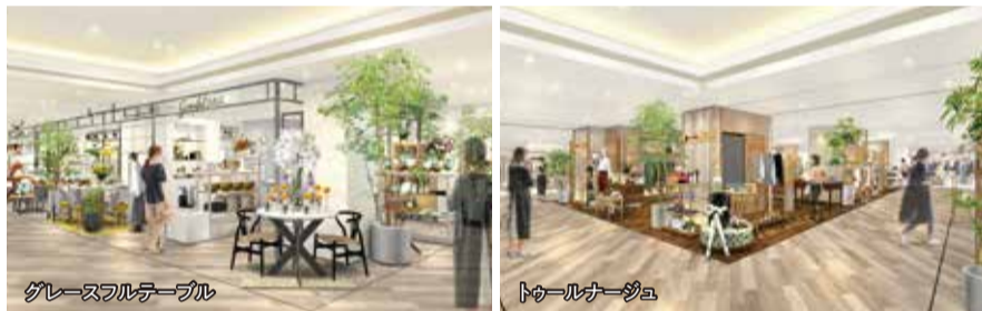
グレースフルテーブル